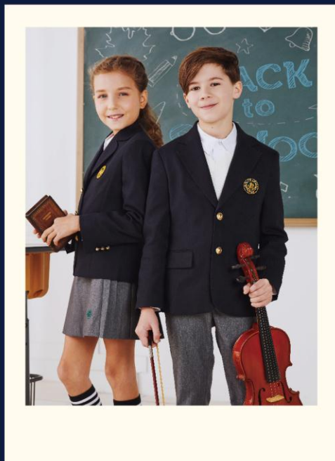
2019 SOONG CHING LING SHCOOL UNIFORM