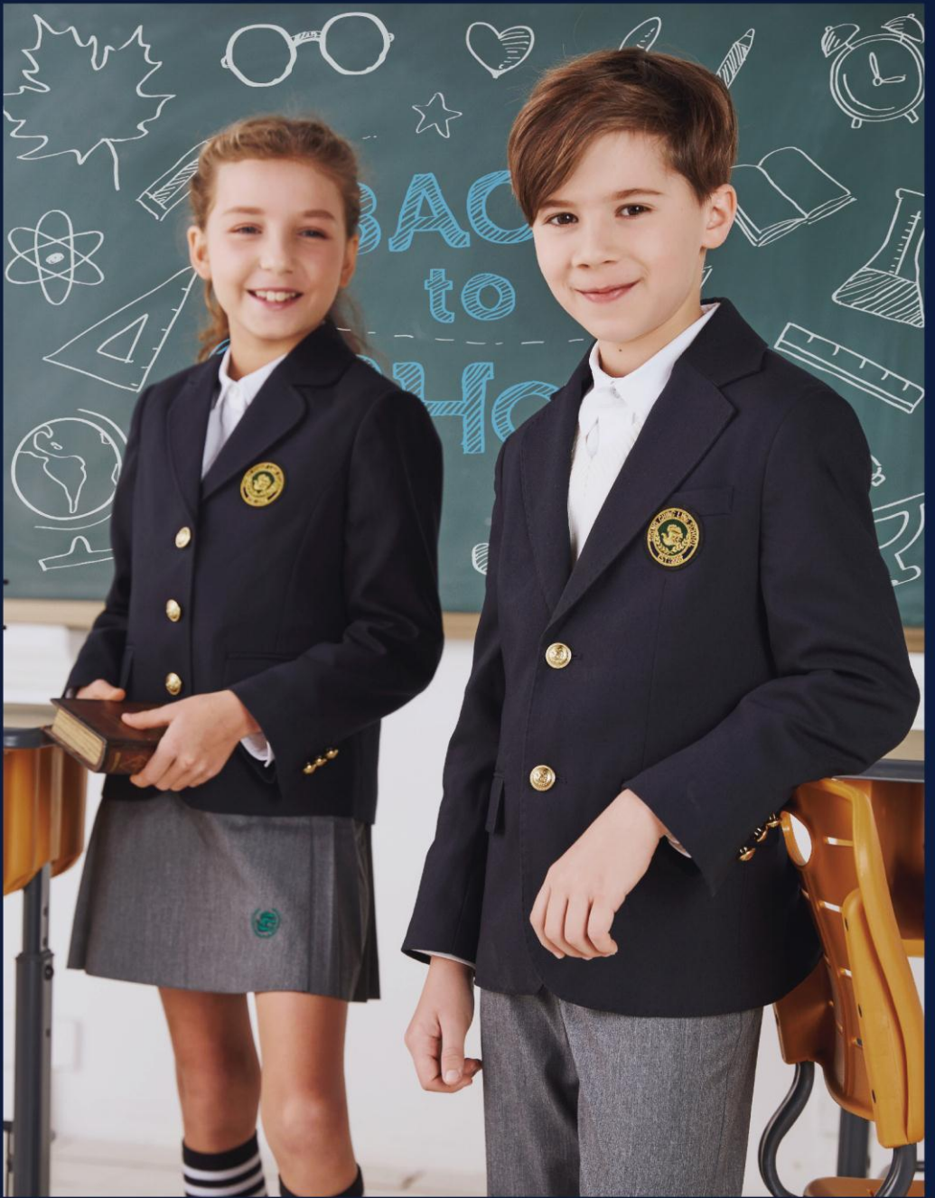
2019 SOONG CHING LING SHCOOL UNIFORM